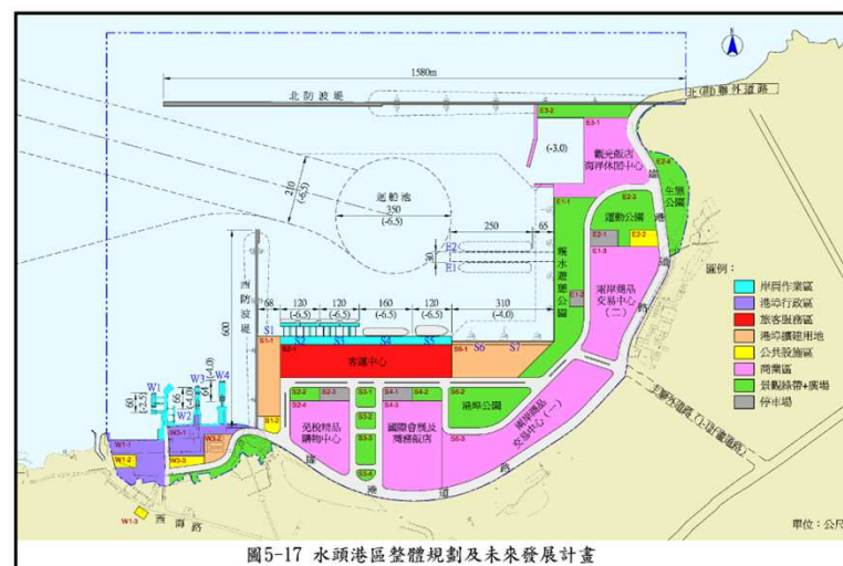
圖5-17 水頭港區整體規劃及未來發展計畫