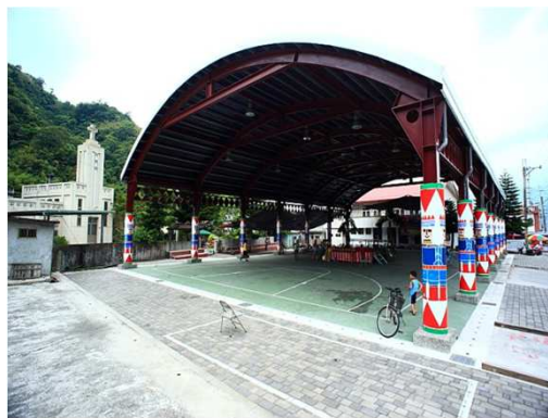
玉里鎮樂合部落跳舞場