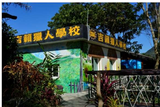
水璉吉籟獵人學校