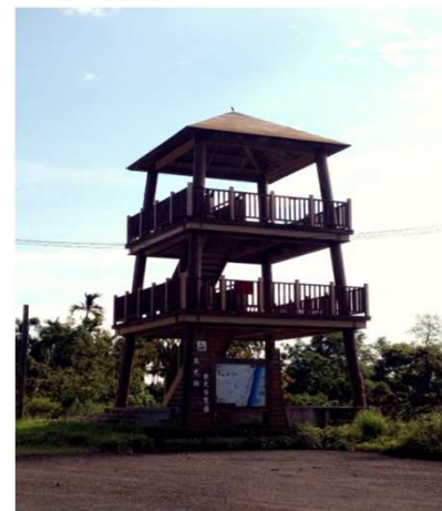
光復鄉太巴壠部落瞭望台