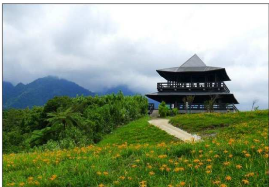
富里鄉六十石山-山嵐亭整修