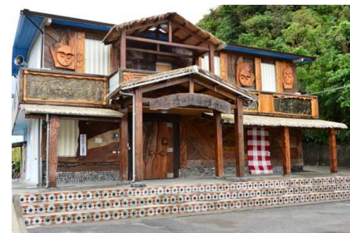
港口部落活動中心