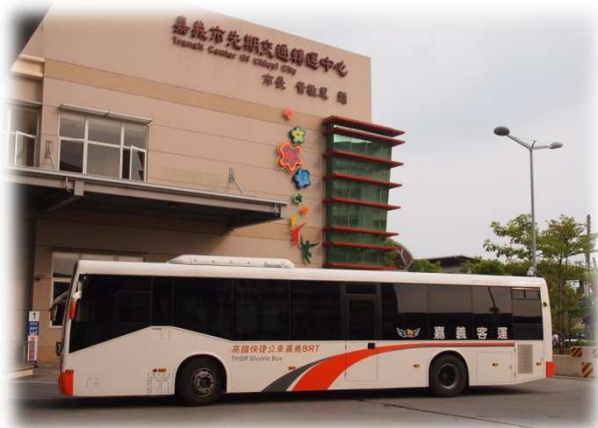
嘉義後站轉運中心 嘉義BRT低地板公車