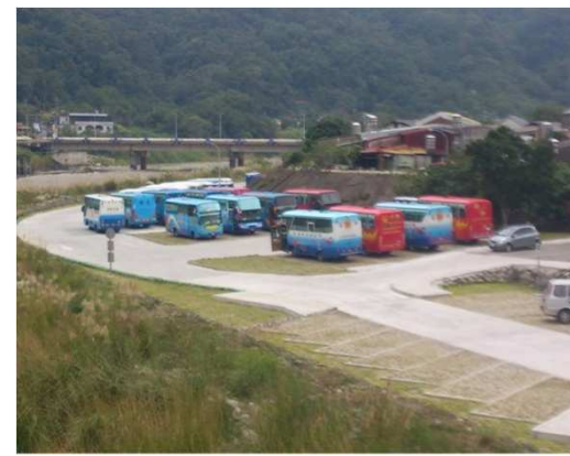
南庄高灘地停車場