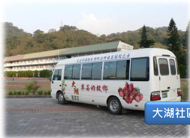
大湖社區接駁巴士