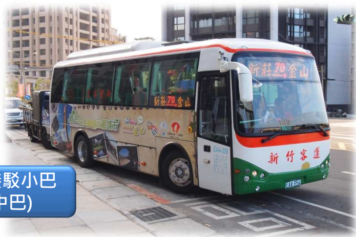
竹塹接駁小巴 (電動中巴)