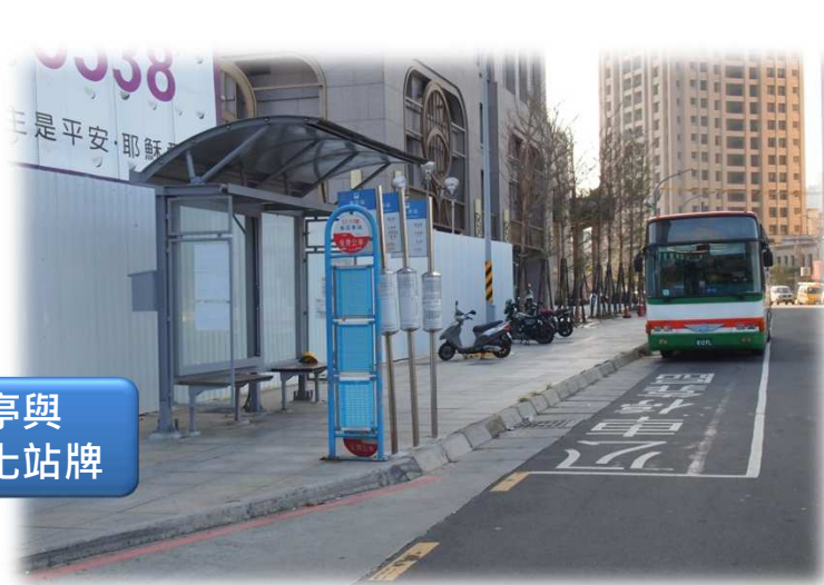
候車亭與 整合化站牌